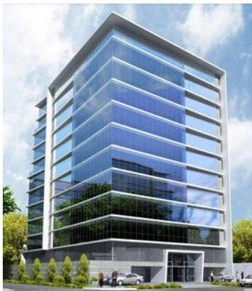
Oficina Corporativa en Lima de UHY BSA. Centro Empresarial La Encalada